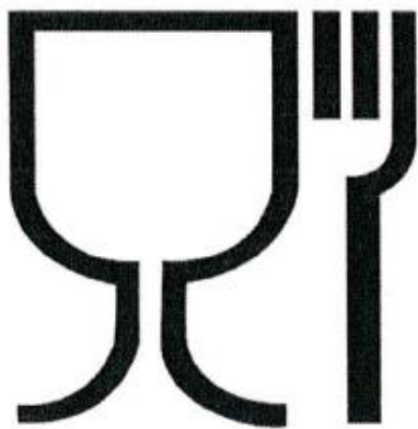
Рис.1. Упаковка (укупорочные средства), предназначенная для контакта с пищевой продукцией

Символы, наносимые на маркировку упаковки (укупорочных средств)